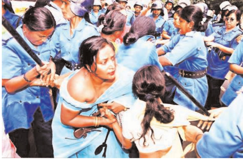
হরতালে অচল সারা দেশ। পুলিশের লাঠিচার্জ, রাবার বুলেট নিক্ষেপ, বিডিআরের গাড়িতে অগ্নিসংযোগ, ঢাকায় বিক্ষোভ সমাবেশ ও মিছিল। হরতালকারীদের মিছিলে পুলিশ লাঠিচার্জ।

আওয়ামী লীগ সভানেত্রী ও জাতীয় সংসদে বিরোধী দলীয় নেতা শেখ হাসিনা অভিযোগ করেছেন, হরকাতুল জেহাদের ক্যাডারদের দিয়ে দেশের বিভিন্ন স্থানে হামলার পরিকল্পনা নিয়েছে সরকার। শেখ হাসিনা টানা ৩৬ হরতাল সফল করার দেশবাসীকে ধন্যবাদ জানিয়ে বলেন, ভোট চুরি আর অর্থ চুরি জনগণ মেনে নেবে না। হাসিনা বলেন, জনগণের ভোটাধিকার প্রতিষ্ঠা করতে হরতালসহ আন্দোলনের কর্মসূচি অব্যাহত থাকবে। টানা ৩৬ ঘণ্টার হরতাল শেষে গতকাল সন্ধ্যায় ধানমন্ডির কার্যালয়ে অনুষ্ঠিত ১৪ দলের জবুরি বৈঠক শেষে আয়োজিত প্রেস ব্রিফিংয়ে শেখ হাসিনা ১৬ জুন থেকে ২ জুলাই পর্যন্ত আন্দোলনের নতুন কর্মসূচি ঘোষণা করেন। কর্মসূচির মধ্যে রয়েছে- ১৬ জুন ঢাকায় বিক্ষোভ সমাবেশ ও মিছিল। ১৭ জুন দেশব্যাপী বিক্ষোভ সমাবেশ ও মিছিল। ১৮ ও ১৯ জুন মহানগরের ধানায় ধানায় ১৪ দল নেতাদের গণসংযোগ। ২০ জুন প্রধান নির্বাচন কমিশন কার্যালয়সহ দেশের প্রতিটি জেলা নির্বাচন কমিশন কার্যালয় অবরোধ। অবরোধ চলবে সকাল ১১টা থেকে বিকেল ৩টা পর্যন্ত।