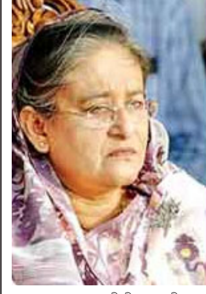
লন্ডনে অবস্থানরত আওয়ামী লীগ সভানেত্রী শেখ হাসিনা গতকাল রয়টার্সকে দেওয়া এক সাক্ষাৎকারে বলেছেন, বাংলাদেশের সরকারের পক্ষ থেকে ফেরা প্রসঙ্গে রয়টার্সকে শেখ হাসিনা ...পৃ ৮