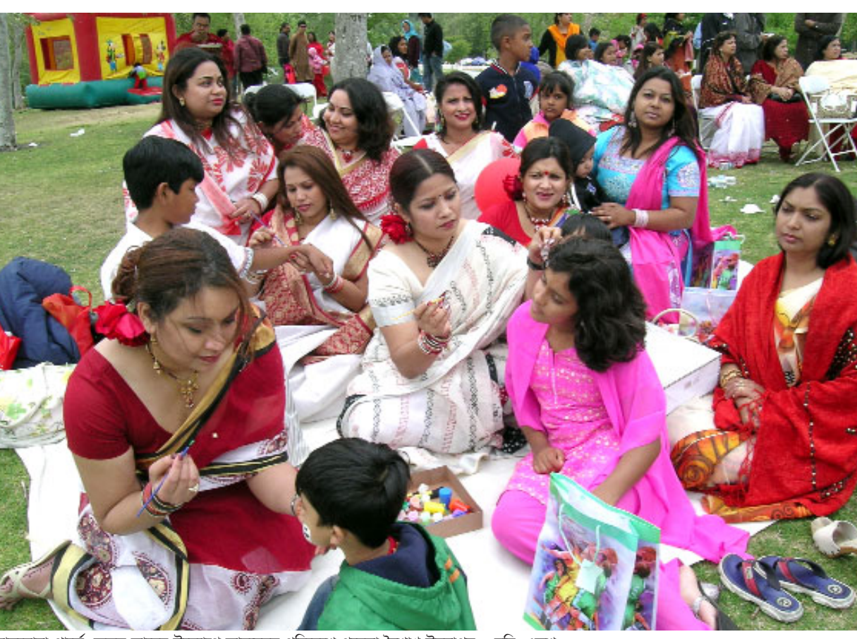
বালবোয়া পার্কে স্ট্রেন্ডস ক্লাবের উদ্যোগে আনন্দঘন পরিবেশে পহেলা বৈশাখ উদযাপন।