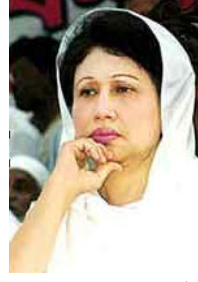
দেশ ছেড়ে যাওয়ার আগে সরকারের কাছে দু’টো শর্তাঙ্গণ করেছেন খালেদা জিয়া। শর্তগুলো হচ্ছে, এক. ছেলে তারেক রহমানকে দ্রুত মুক্তি দই. দলের সঙ্গে একবার ...পৃ ৮