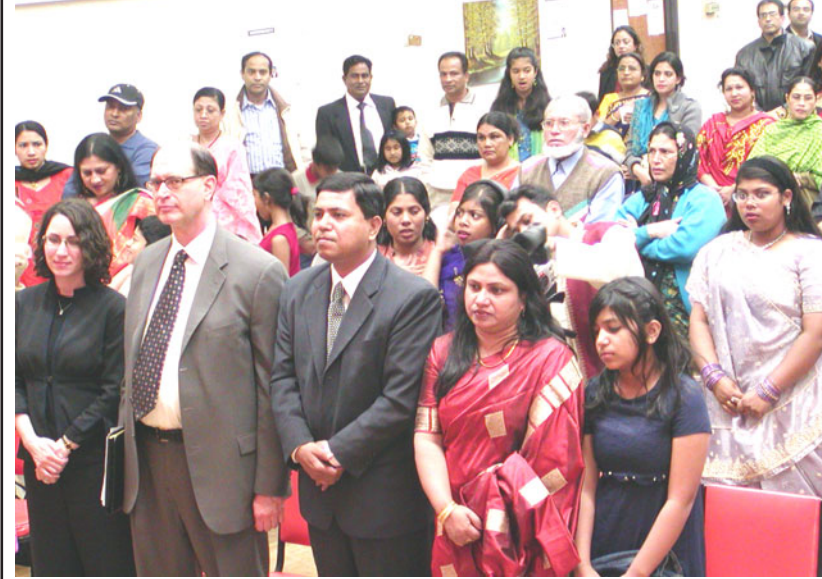
বাংলাদেশ এসোসিয়েশন অব ভ্যালী, লস এঞ্জেলসে আয়োজিত ৩৬তম স্বাধীনতা দিবস অনুষ্ঠানে দাঁড়িয়ে অন্যান্যদের সাথে শঙ্কা জানালেন সাথে সত্ৰীক কনসাল জেনারেল ও কংগ্রেসম্যান ব্র্যাড শারমেন।