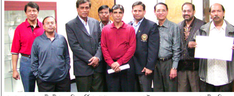
বাংলাদেশ আওয়ামী লীগ ক্যালিফোর্নিয়া শাখার নেতৃত্বে যুক্তরাষ্ট্রের লস এঞ্জেলসে-এ প্রবাসী মুক্তিযুদ্ধের স্বপ্নক শক্তির পক্ষ থেকে লস এঞ্জেলসে কনসাল্টেট স্মারকলিপি হস্তান্তর।

গত ১৬ এপ্রিল, ২০০৭ বাংলাদেশ আওয়ামী লীগ ক্যালিফোর্নিয়া শাখার নেতৃত্বে যুক্তরাষ্ট্রের লস