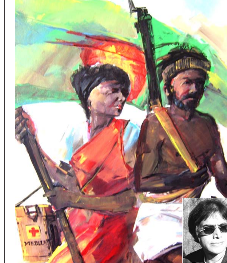
বিজয়ের উল্লাস - শিল্পী মামুন রিয়াজীর তৈলচিত্র।