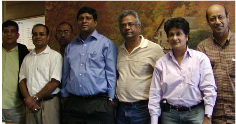
ঢাকা বিশ্ববিদ্যালয় এলএমআই এসোসিয়েশন অফ ক্যালিফোর্নিয়ার আহ্বায়ক কমিটির সঙ্গে মিডিয়া পার্টনারবৃন্দ