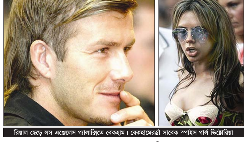
রিয়াল ছেড্ডে লস এঞ্জেলসে গ্যালাক্সিতে বেকহাম। বেকহামের স্ত্রী সাবেক স্পাইস গার্ল ভিক্টোরিয়া