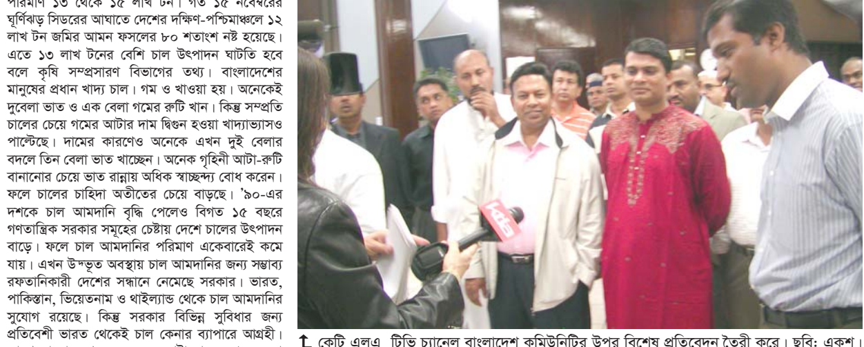
লস এঞ্জেলসে টাইমস-এর হেড লাইনে উল্লেখ ছিল কনসুলেট অফিস এবং প্রবাসী কমিউনিটি রিলিফ সংগ্রহ করছে বাংলাদেশের সাইক্লোন ক্ষতিগ্রস্তদের জন্য। এই পরিপ্রেক্ষিতে মূলধারার মানুষ ও সংগঠন এগিয়ে আসে সাহায্যের হস্ত সম্প্রসারিত করে।