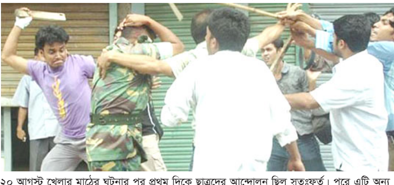
২০ আগস্ট খেলার মার্চের ঘটনার পর প্রথম দিকে ছাত্রদের আন্দোলন ছিল স্নাতকস্নাতক। পরে এটি অন্য খাতে প্রবাহিত হয়েছে।