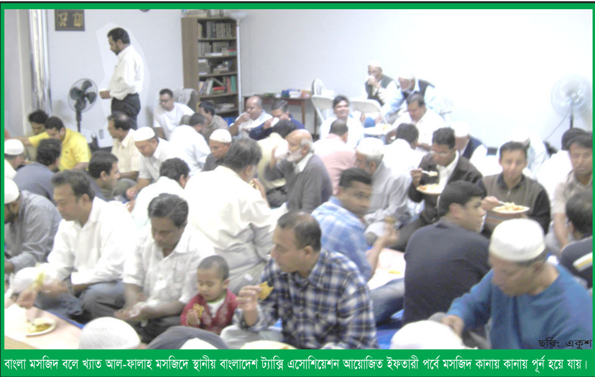
বাংলা মসজিদ বলে খ্যাত আল-ফালাহ মসজিদে স্থানীয় বাংলাদেশ ট্যাক্সি এসোসিয়েশন আয়োজিত ইফতারী পর্বে মসজিদ কানায় কানায় পূর্ণ হয়ে যায়।