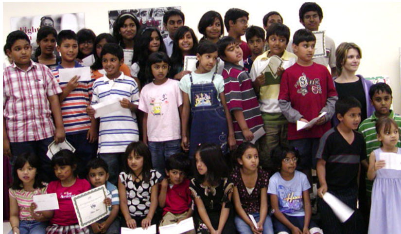
উপরে সায়ের্স ফেয়ারে ক্ষুদ্র অংশগ্রহণকারীদের দেখা যাচ্ছে। 'সায়ের্স এন্ড অন সাইট আর্ট ফেয়ার, ২০০৭ এর বিজয়ীরা ও অংশগ্রহণকারীবৃন্দ।

হয়। এএবিইএ ৬/৭ বছর যাবত সায়ের্স ফেয়ার লণ্ডনা মেরিমাউন্ট বিশ্ববিদ্যালয়ে করে আসছিলো। এবারই প্রথম যৌথভাবে ও আর্ট প্রতিযোগিতার সংযোজনের মাধ্যমে লস এঞ্জেলসে অর্ধবছর একটি ফেয়ার বা মেলা উপহার দেয়। নতুন প্রজন্মের জন্য লস এঞ্জেলসে উক্ত ফেয়ার সবচেয়ে অন্যতম দৃষ্টান্ত। যার মাধ্যমে বাংলাদেশের শিল্প ও সংস্কৃতির সেতুবন্ধন সৃষ্টি হয়েছে। ছেলেমেয়েরা