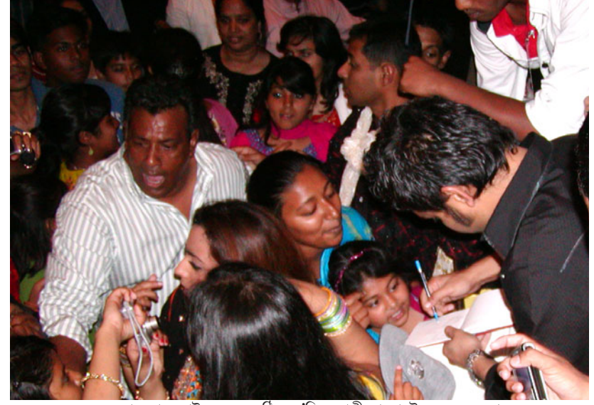
লস এঞ্জেলসের ফেয়ারফায়ার হাই স্কুলে অনুষ্ঠিত দু'দিন ব্যাপী বাংলা উৎসবে নতুন প্রজন্মের ভক্তদের অটোগ্রাফ দিচ্ছেন হাবিব।

গত ২০ জুন, ২০০৭ একুশ প্রতিনিধির আমন্ত্রণে একটি সাক্ষাতকার দিয়েছেন শিল্পী হাবিব ওয়াহিদ।