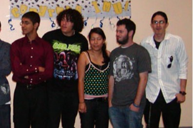
সম্পর্কে বক্তব্য শুনি। এইগুলো অত্যন্ত জরুরী। শুধু নিজেদের ব্যক্তিগত স্বার্থ এবং কমিউনিটির মধ্যে কোন্দল করে কোন ফায়দা হবে না, যদি নতুন প্রজন্ম বাংলাদেশের পতাকার হাল ধরে।

গ্র্যাজুয়েশনের পর গ্রীষ্মের ছুটি শুরু হয়ে গেছে। সম্প্রদায়িকভাবে আমরা একটি প্রস্তাব দিয়েছি। তেমনভাবে আভিভাবকদের প্রতি আহ্বান যারা বাসায় থাকবে তাদেরকে বাংলা স্কুলে নিয়ে যান, ধর্মীয় শিক্ষা প্রদান করুন এবং এ দেশের অ ভি ভা ব ক দে র স সচেতন থাকতে হবে এবং