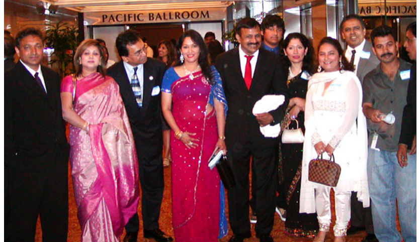
লস এঞ্জেলসের সাউথ এশিয়ান বিজনেস এলায়েন্স নেটওয়ার্ক অন্যান্য দেশের ব্যবসায়ীদের সাথে বাংলাদেশী ব্যবসায়ী সম্প্রদায়।

প্রথম পাতার পর: "সাবান" অর্থাৎ সাউথ এশিয়ান বিজনেস এলায়েন্স নেটওয়ার্ক। আমেরিকায় বসবাসরত সাউথ এশিয়ান মানুষের ব্যবসা বাণিজ্যের সুযোগ সুবিধা ও জীবনযাত্রা উন্নত করার লক্ষ্যে সাবানের সৃষ্টি হয়েছে ১৯৯৮ সনে। সাংগঠনিক কর্মতৎপরতার প্রফেশনাল ব্যবসাকে উৎসাহ ও উদ্দীপনার ক্ষেত্র এবং আমেরিকায় সাউথ এশিয়ান মালিকানাধীন ছোট বড় সকল ব্যবসায়ীদের প্রতিনিধিত্বমূলক সংগঠন হিসাবে...পূ...৩