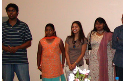
নর্থরিঞ্জের গিসান-এর গুণনি হলো নতুন প্রজন্মের গ্র্যাজুয়েশন অনুষ্ঠান সেলিব্রেশন কয়েকজন শিক্ষার্থী।

ব্যবস্থা করণ। নতুন প্রজন্মেরকে অনুভব করান আমরা তাদের জন্য কেয়ার করি। তাহলে তারাও আমাদের জন্য সহায়ত্বশীল হবে। কমিউনিটির মধ্যে এদেশের পরিচয় করিয়ে দেই এবং কমিউনিটির প্রতি তাদের মনোভাব এবং অংশগ্রহণ